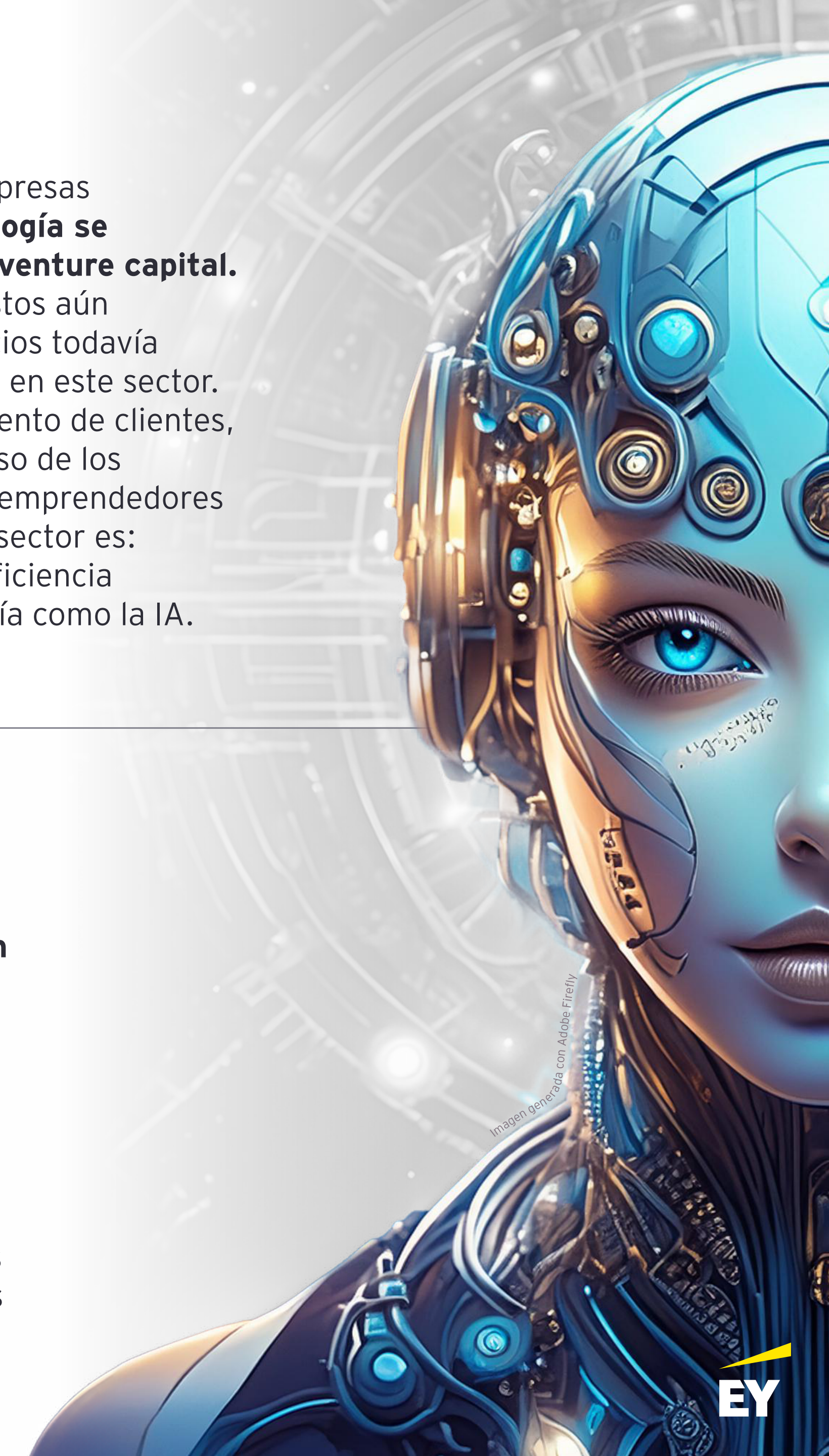
Imagen generada con Adobe Firefly

El servicio lo es todo. La pandemia enseñó a las grandes empresas y emprendedores que la seguridad de la cadena de suministro es clave a la hora de ofrecer un servicio diferenciador y constante. En esto, cada día vemos más emprendimientos enfocados en servicios internos para las empresas (gestión de finanzas o recursos humanos, por ejemplo) y en mejorar la experiencia de clientes no sólo en el despacho y post venta, sino también siendo capaces de reconocer las necesidades de las audiencias, generando productos y servicios para sus necesidades particulares.