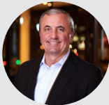
Carmine Di Sibio, presidente y CEO de EY Global

Este documento pretende facilitar este proceso y ayudar a los distintos agentes a comprender y evaluar mejor el panorama regulatorio de la IA en ocho territorios, que incluyen Canadá, China, la Unión Europea, Japón, Corea del Sur, Singapur, el Reino Unido y Estados Unidos. En última instancia, si todos estamos mejor informados, podremos contribuir más fácilmente al desarrollo de regulación comparable e interoperable en todos los países, ayudar a reducir el riesgo en el arbitraje regulatorio y ampliar el alcance de las normas que promuevan el uso positivo de la IA.