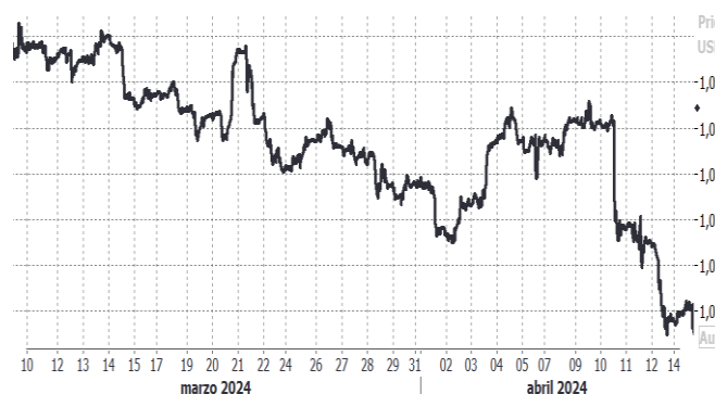
USD/EUR, evolución semanal