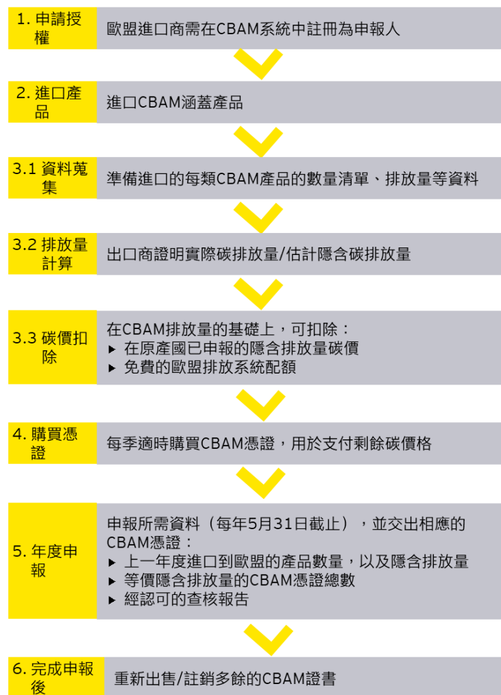
圖三、CBAM 正式工作機制

如果以實際排放量進行 CBAM 申報，排放數據必須經由有資格的獨立審查單位查核認證，否則，必須使用標準的預設值（Default Values）來反映特定國家或地區生產某種產品的平均排放量。如果沒有可靠資訊可用於設定預設值，歐盟執委會將以歐盟表現最差的同類設施作為預設值基準。具體細節尚待官方公布補充指導文件。