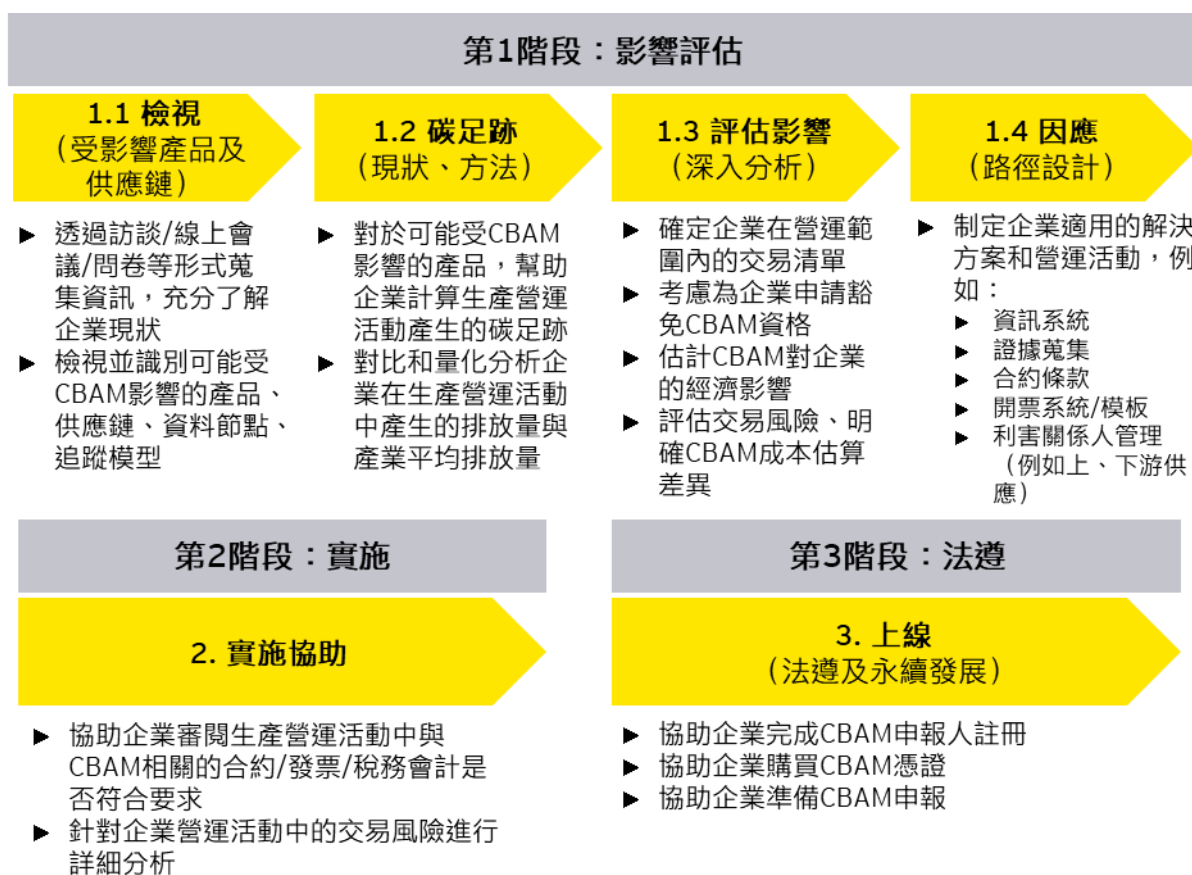
圖四、安永 CBAM 服務

安永團隊密切關注氣候變遷與永續發展，我們在協助企業規劃和制定氣候變遷策略、永續發展服務、氣候監管法遵等方面有著豐富經驗。憑藉我們對 CBAM 的持續關注和洞察，我們可為您提供全面的 CBAM 服務方案。