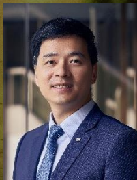
安永聯合會計師事務所 稅務服務部