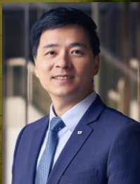
安永聯合會計師事務所 稅務服務部

繼2020年香港特區政府施政報告發布以來，特區政府一直在積極推動家辦業務在香港的發展，希望以優惠的政策將香港打造成為更理想的家辦樞紐。香港特區財經事務及庫務局向業界專業團體發出了公開諮詢檔，詳細介紹了為單一家族辦公室（Single Family Office, SFO）所管理的符合資格家族投資控股實體（Family-owned Investment Holding Vehicles, FIHV）所得稅稅務寬免的擬議優惠政策法案，相關優惠政策從2022年4月1日生效。本文將該規定的背景及核心要點歸納如下，並與新加坡的現有相關政策進行比較，供大家參考。