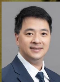
安永聯合會計師事務所 稅務服務部

本篇前瞻觀點將針對本次裁定(最高法院108年度台抗大字第897號民事裁定)及其影響為讀者進行說明。